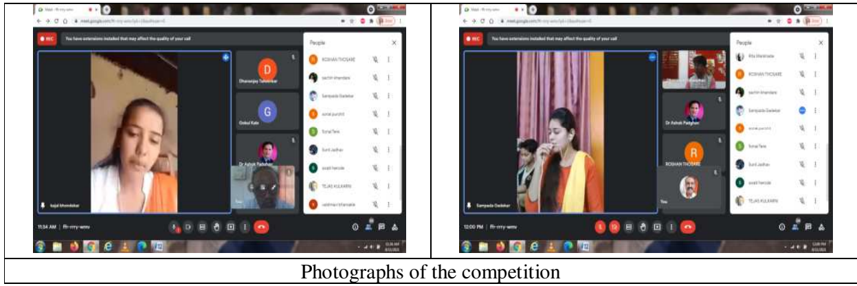
Photographs of the competition