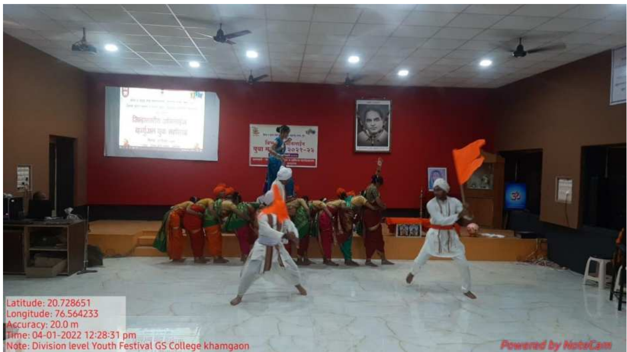
Figure 2: Performance at Division Level (Dindi)