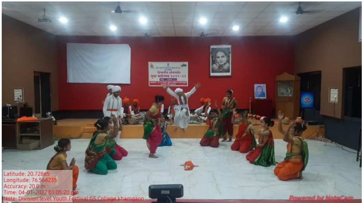
Figure 1: Performance at Division Level (Dindi)