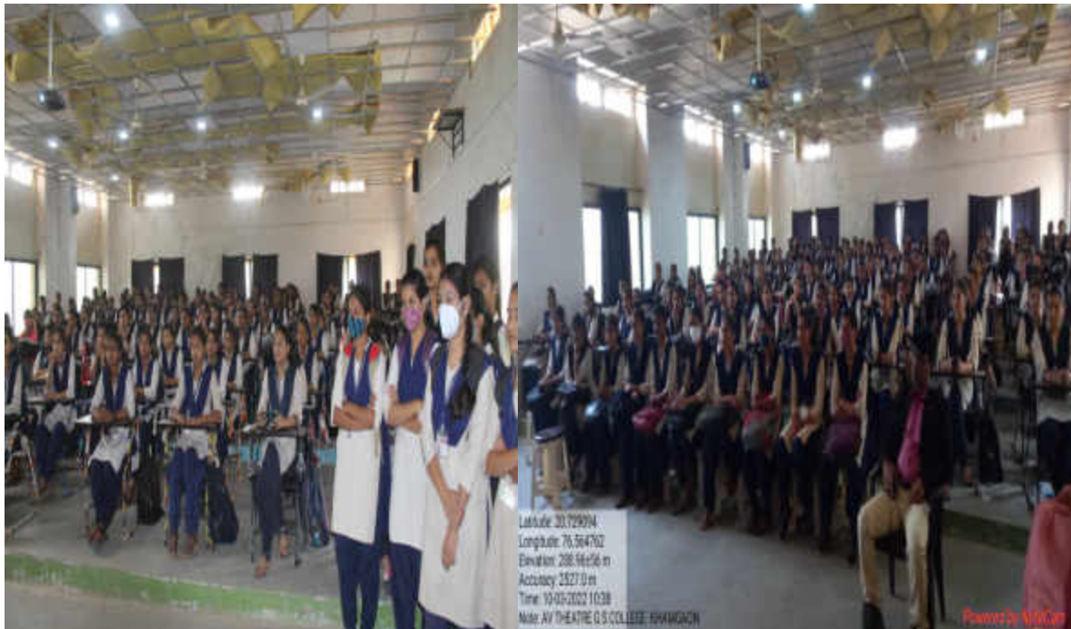
Figure 2 : Students present for the programme