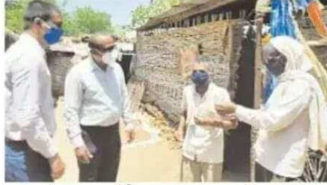
गरजूंना मास्क व सॅनिटायझर वाटप करतांना मान्यवर

आज ग्रामीण भागातील परिस्थिती कोविड-१९ संसर्ग संदर्भात चांगली असून ती टिकून ठेवण्यासाठी सर्वांनी सामूहिक