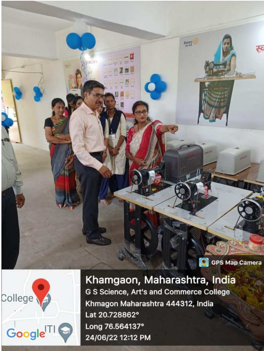
Opening of Tailoring and Fashion Design Skill Development Training Centre