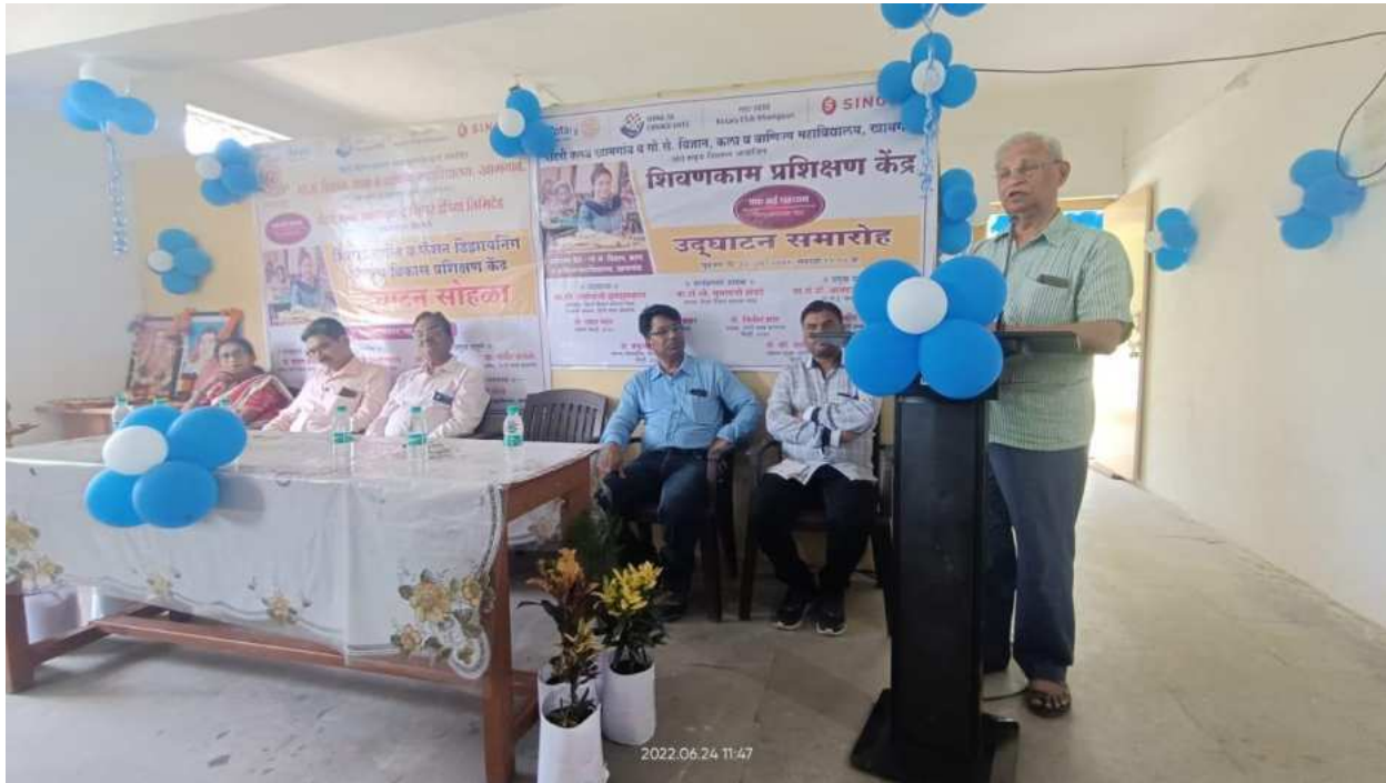
Opening of Tailoring and Fashion Design Skill Development Training Centre