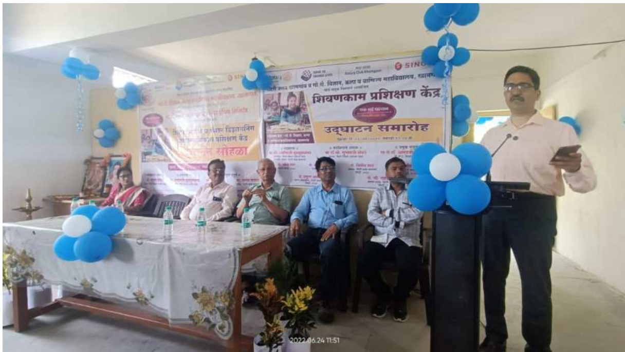
Opening of Tailoring and Fashion Design Skill Development Training Centre