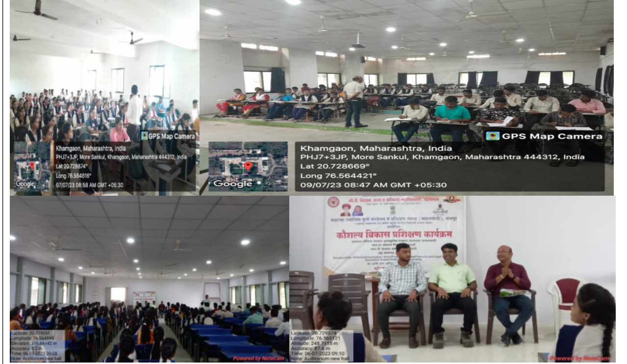
Add appropriate caption which include name of the resource person, topic, etc.