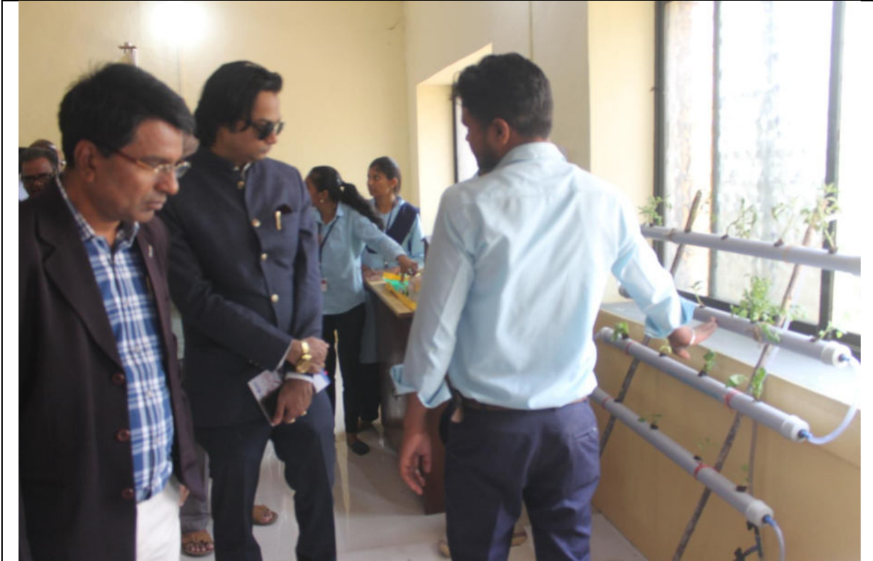
Participants Students with their projects