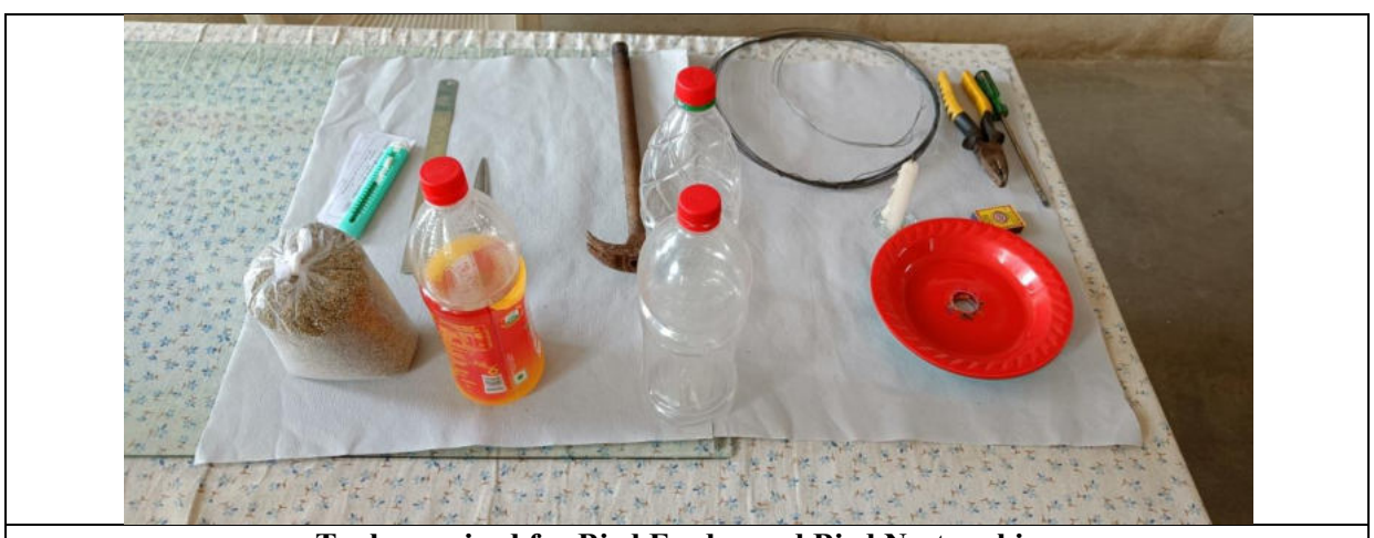
Tools required for Bird Feeder and Bird Nest making