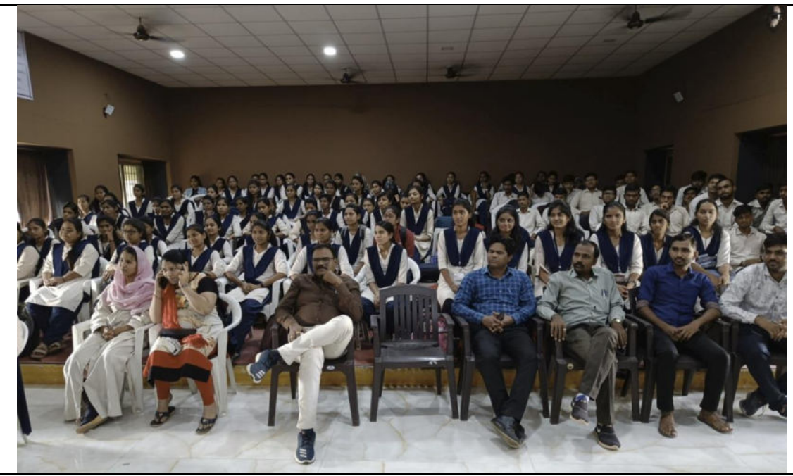
Huge response of the Students and the Staff