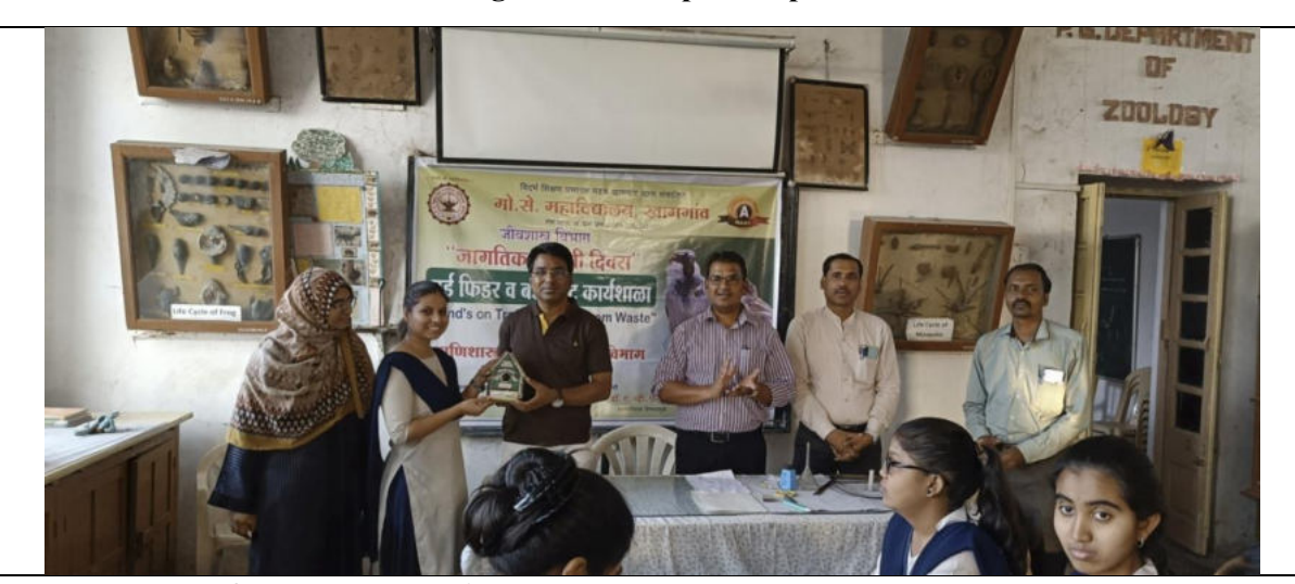
The feeders made during the workshop ,were presented to the students.