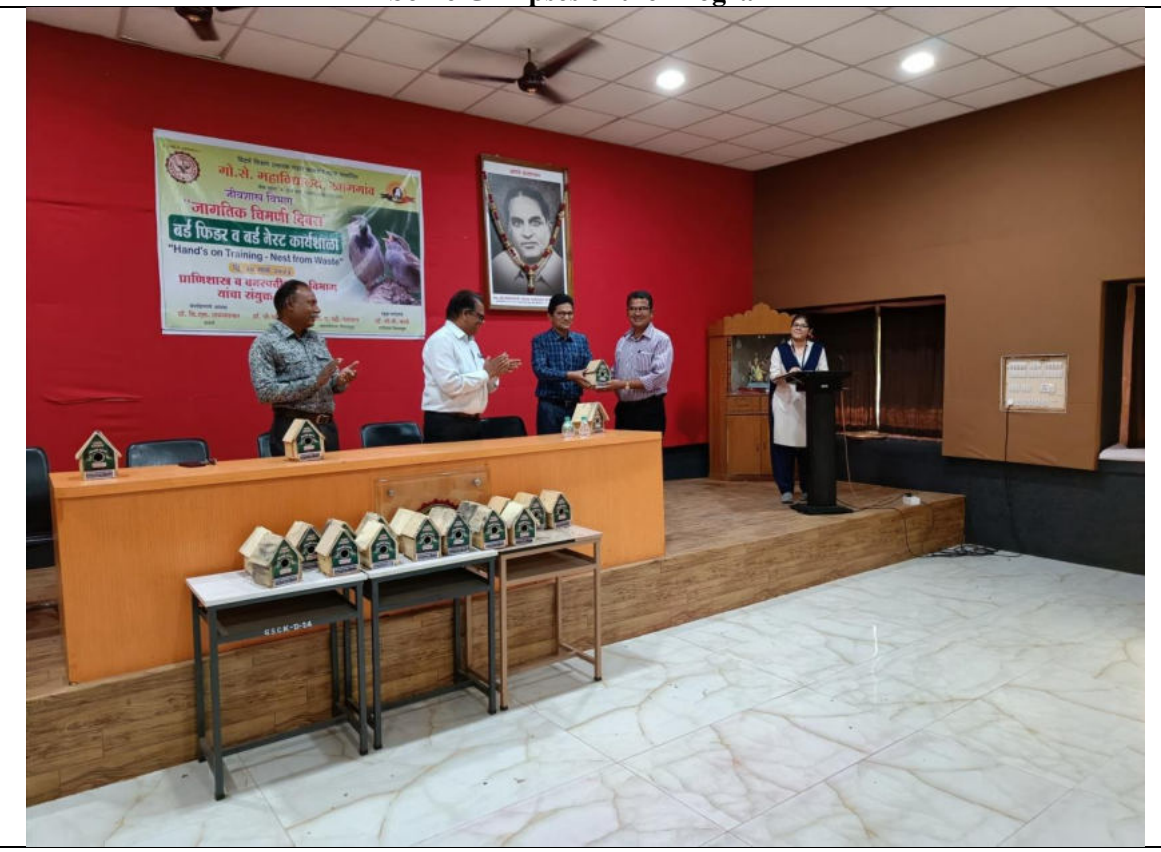
Welcome of the Guests and the organizers