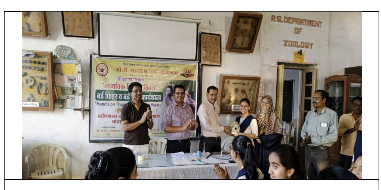
The feeders made during the workshop ,were presented to the students.