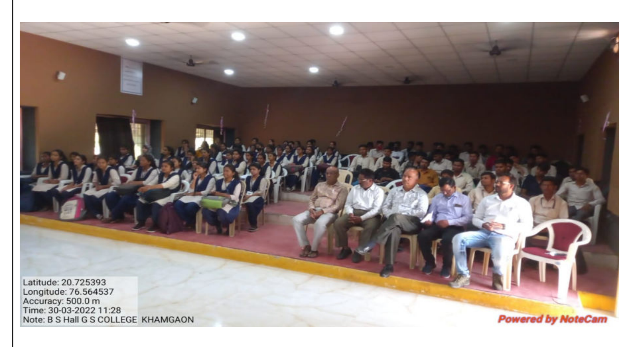
Figure 2: Students attendance at the programme